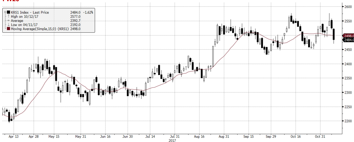
KRS1 Index (NSE WIG20 Index Future) graph 1550 Daily 06APR2017-10NOV2017