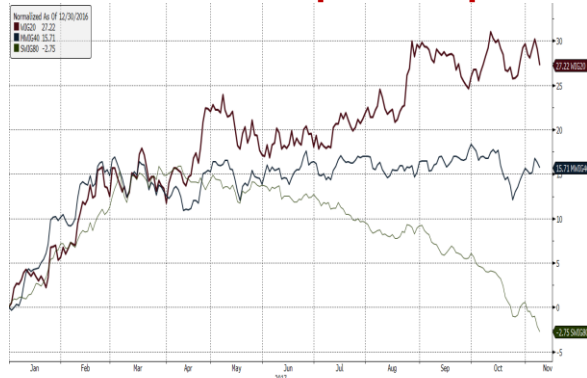
WIG20 Index (WIG20) G111 Daily 2006022016-10NOV2017 10-Nov-2017 07:40:08