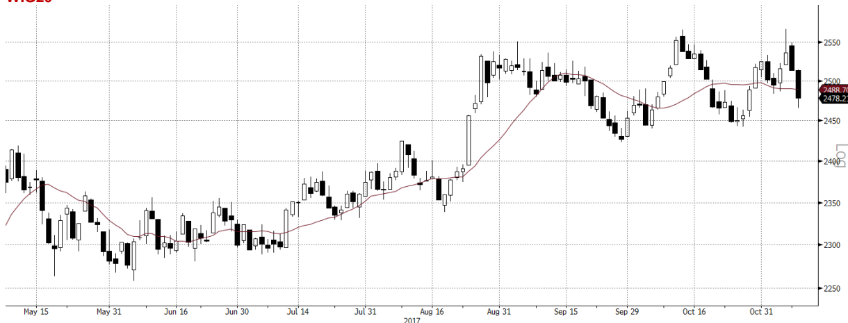
WIG20 Index (WIG20) G1598 Daily 07MAY2017-10NOV2017