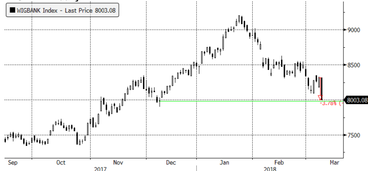
WIGBANK Index (Warsaw Stock Exchange WIG Banking Index) Graph 1692 Daily 09SEP2 Copyright© 2018 Bloomberg Finance L.P. 09-Mar-2018 08:12:54 Źródło: Dom Maklerski BDM S.A., Bloomberg