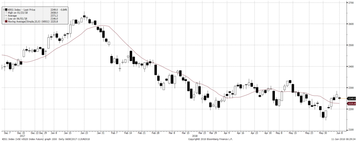
KRS1 Index (KRS Index Future) graph 1550 Daily 06DEC2017-11JUN2018