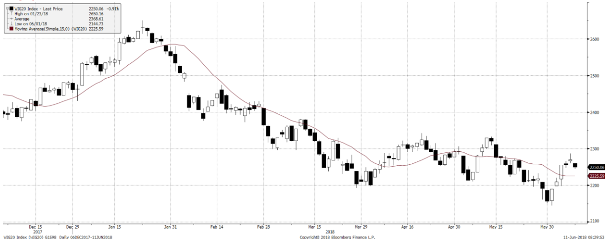
WIG20 Index (WIG20) g1598 Daily 06DEC2017-11JUN2018