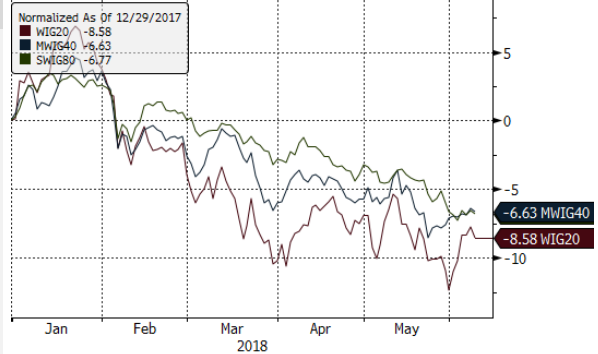
WIG20 Index (WIG20) g1111 Daily 29DEC2017-11JUN2018 Copyright© 2018 Bloomberg Finance L.P. 11-Jun-2018 08:29:06 Źródło: Bloomberg, Dom Maklerski BDM S.A.