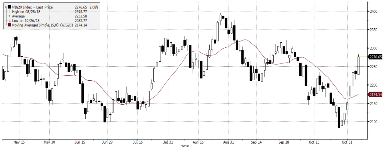
WIG20 Index (WIG20) G1598 Daily 07MAY2018-08NOV2018