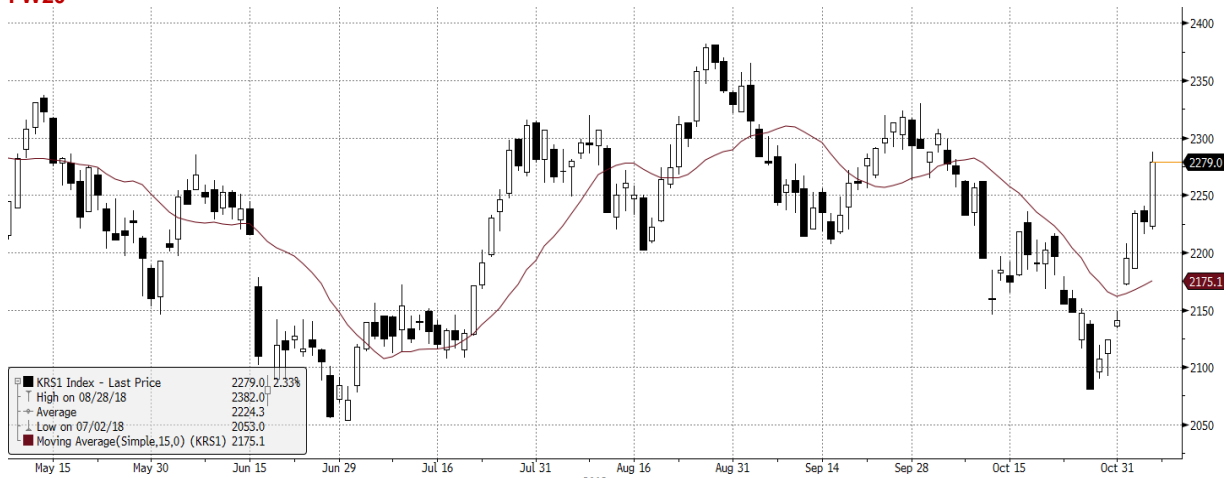
KRS1 Index (WSE WIG20 Index Future) graph 1550 Daily 08MAY2018-08NOV2018