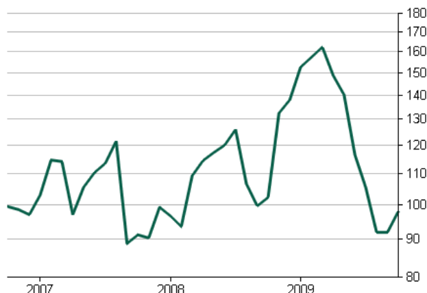
Prezentacja przykładowa. Bieżący skład portfela jest dostosowywany do aktualnej sytuacji rynkowej.